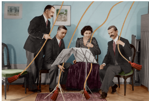
"Quatuor à cordes - L'accordage avant l'exécution"